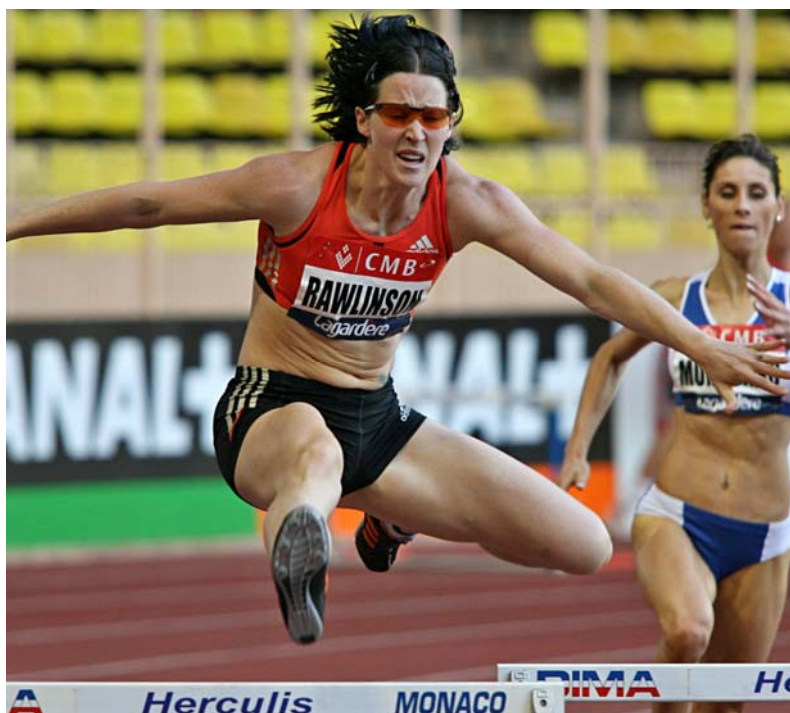
Jana PITTMAN : un personnage !